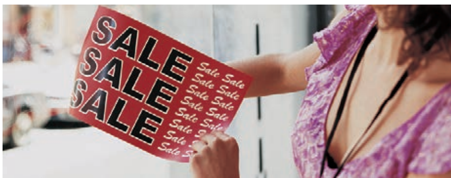
Insegne per vetrine Xerox® NeverTear

Il nostro speciale toner EA a bassissima temperatura di fusione utilizza una speciale ed esclusiva tecnologia di legame chimico che garantisce una qualità delle immagini superiore su supporti speciali come poliestere e altro. Il nostro toner EA è utilizzato anche sul supporto Premium NeverTear, resistente all'acqua, all'olio, al grasso e agli strappi.